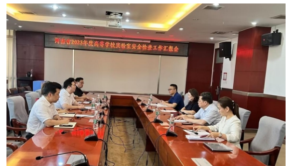
(文/毛华中)