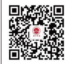
校报编辑部官方微信